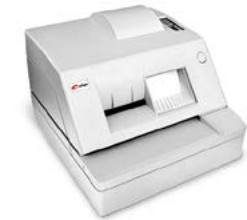
Модель ПРИМ 07-Ф

Рекомендованная розничная цена (с учетом фискального накопителя)