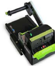
Модель ПРИМ 21-ФА

Рекомендованная розничная цена (с учетом фискального накопителя)