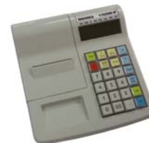
Модель МИНИКА 1102МК-Ф

Рекомендованная розничная цена (с учетом фискального накопителя)