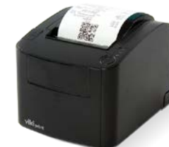
Модель Вики Принт 80 плюс Ф

Рекомендованная розничная цена (с учетом фискального накопителя)