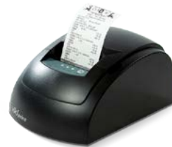
Модель Вики Принт 57Ф

Рекомендованная розничная цена (с учетом фискального накопителя)