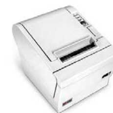
Модель ПРИМ 88-Ф

Рекомендованная розничная цена (с учетом фискального накопителя)