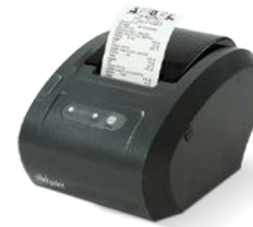
Модель Вики Принт 57 плюс Ф

Рекомендованная розничная цена (с учетом фискального накопителя)