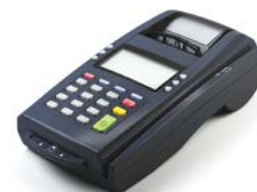
Модель ЯРУС ТФ

Рекомендованная розничная цена (с учетом фискального накопителя)