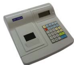
Модель ЭКР 2102К-Ф

Рекомендованная розничная цена (с учетом фискального накопителя)