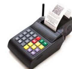
Модель АТОЛ 90Ф

Рекомендованная розничная цена (с учетом фискального накопителя)