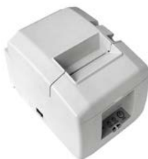
Модель ПРИМ 08-Ф

Рекомендованная розничная цена (с учетом фискального накопителя)