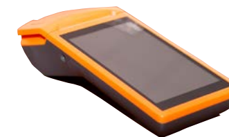
Модель ПТК «MSPOS-K»

Рекомендованная розничная цена (с учетом фискального накопителя)