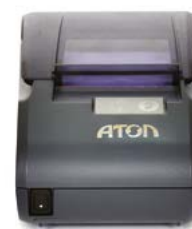
Модель АТОЛ 30 Ф

Рекомендованная розничная цена (с учетом фискального накопителя)