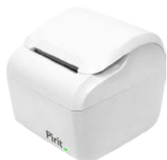
Модель Пирит 2Ф/Пирит 2СФ

Рекомендованная розничная цена (с учетом фискального накопителя)