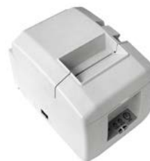
Модель ПРИМ 08-Ф

Рекомендованная розничная цена (с учетом фискального накопителя)