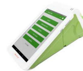
Модель Эвотор СТ2Ф

Рекомендованная розничная цена (с учетом фискального накопителя)