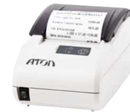
Модель АТОЛ 11Ф

Рекомендованная розничная цена (с учетом фискального накопителя)