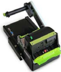
Модель ПРИМ 21-ФА

Рекомендованная розничная цена (с учетом фискального накопителя)