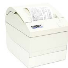
Модель Пирит 1Ф

Пирит 2Ф – от 33 000 руб. Пирит 2СФ (с Ethernet кабелем) – от 36 000 руб.