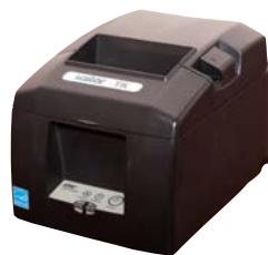
Модель ПТК «MSTAR-TK»

Рекомендованная розничная цена (с учетом фискального накопителя)