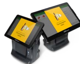
Модель Viki Tower F

Рекомендованная розничная цена (с учетом фискального накопителя)