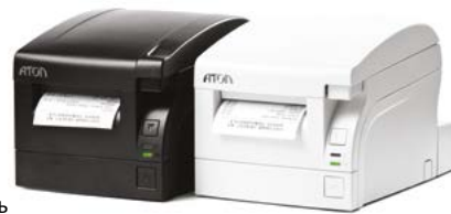
Модель АТОЛ 77Ф

Рекомендованная розничная цена (с учетом фискального накопителя)