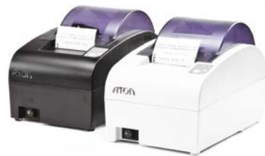
Модель АТОЛ 55Ф

Рекомендованная розничная цена (с учетом фискального накопителя)