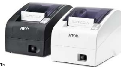
Модель АТОЛ FPrint-22ПТК

Рекомендованная розничная цена (с учетом фискального накопителя)