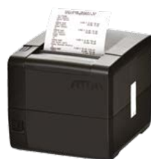
Модель АТОЛ 25Ф

Рекомендованная розничная цена (с учетом фискального накопителя)