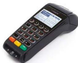
Модель ЯРУС М2100Ф

Рекомендованная розничная цена (с учетом фискального накопителя)