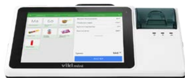
Модель Вики мини Ф

Рекомендованная розничная цена (с учетом фискального накопителя)