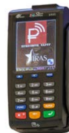
Модель ПТК «IRAS 900 K»

Рекомендованная розничная цена (с учетом фискального накопителя)